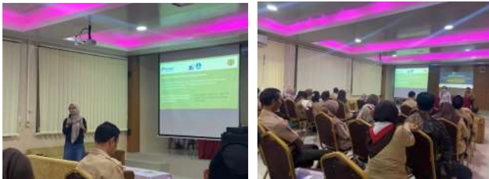
Gambar 1. Tahap sosialisasi kegiatan PKM

Tahapan sosialisasi (Gambar 1) meliputi aktivitas menjelaskan latar belakang, tujuan, lini masa kegiatan, dan manfaat dari kegiatan pemberdayaan kemitraan kepada seluruh guru SMPN 229 Jakarta; membangun komitmen untuk mengikuti dan berpartisipasi aktif dalam kegiatan pemberdayaan kemitraan; memaparkan aktivitas-aktivitas yang akan dilakukan selama kegiatan pemberdayaan kemitraan sehingga memiliki persepsi yang sama. Pada tahap sosialisasi menggunakan metode presentasi dan diskusi interaktif antara tim kegiatan pemberdayaan kemitraan dengan guru-guru SMPN 229 Jakarta.