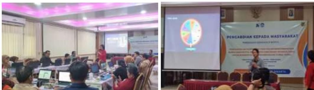
Gambar 2. Tahap pelatihan kegiatan PKM

mengenai praktik yang dilakukan oleh guru dalam mengembangkan bahan ajar; meminta setiap individu guru untuk menunjukkan bahan ajar yang dikembangkan berdasarkan mata pelajaran yang diampu; meminta setiap individu guru menganalisis apakah bahan ajar mereka sudah memuat komunikasi interkultural; memaparkan dan mendiskusikan proses mengembangkan bahan ajar; menjelaskan dan mendiskusikan komunikasi interkultural dalam pembelajaran; mendeskripsikan bahan ajar multimodal dan meminta setiap individu guru menunjukkan bahan ajar yang mereka kembangkan apakah sudah berbasis multimodal; mengulas dan mendiskusikan pembelajaran berpikir kritis; meminta setiap individu guru mengidentifikasi capaian pembelajaran dan mengintegrasikan dengan komunikasi interkultural; menjelaskan dan mendiskusikan aktivitas-aktivitas yang dikembangkan dalam bahan ajar yang bermuatan interkultural dan berpikir kritis, memaparkan penilaian untuk aktivitas-aktivitas yang bermuatan komunikasi interkultural dan berpikir kritis; meminta setiap individu guru untuk mengembangkan bahan ajar yang bermuatan komunikasi interkultural termasuk penilaiannya; meminta setiap individu guru untuk memberikan umpan balik ( peer-review ) dan mempresentasikan bahan ajar yang telah dikembangkan.