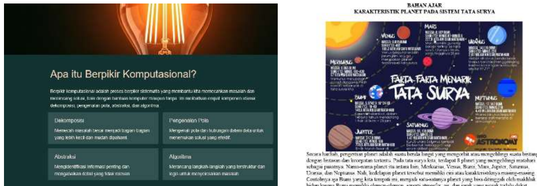
Gambar 4. Contoh bahan ajar yang dibuat oleh guru (sebelum pelatihan)

interkultural akan mendorong siswa untuk menghargai budayanya sendiri dan budaya orang lain (Kirkgöz & Ağçam, 2011; Silvia, 2015). Selain itu bahan ajar yang terdiri atas aktivitas icebreaking penting dilakukan karena dapat melibatkan siswa secara afektif dan kognitif (Tomlinson & Masuhara, 2018)