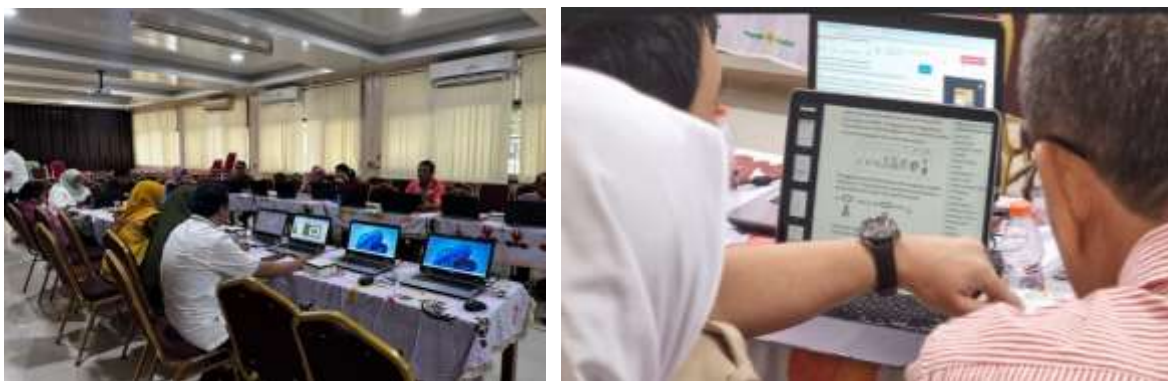
Gambar 3. Tahap pendampingan kegiatan PKM