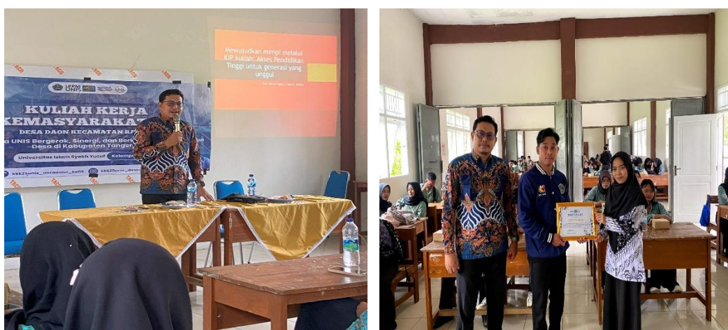
Gambar 2. Dokumentasi Sosialisasi Kegiatan PKM

Hasil dari pelaksanaan kegiatan ini menunjukkan antusias yang tinggi dan menghasilkan pemahaman signifikan pada peserta. Berdasarkan hasil pre-test dan post-test , diketahui bahwa sebelum sosialisasi hanya sekitar 28% siswa yang memahami alur pendaftaran KIP kuliah, sedangkan setelah dilakukan sosialisasi angka tersebut meningkat menjadi 82%. Hal ini mengindikasikan bahwa metode penyampaian yang digunakan efektif dalam memperbaiki literasi informasi siswa terkait program KIP kuliah. Begitu pula pada aspek kemampuan mempersiapkan dokumen administratif, pemahaman siswa meningkat dari 35% menjadi 76%. Sementara itu, rasa percaya diri siswa untuk melakukan pendaftaran KIP kuliah juga mengalami kenaikan dari 30% menjadi 72%.