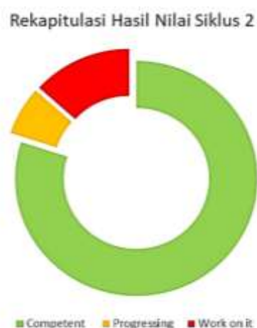
Gambar 2. Diagram lingkaran Hasil Siklus 2

Data penelitian setelah melakukan tindakan pada siklus 2 selengkapnya disajikan pada Gambar 2.